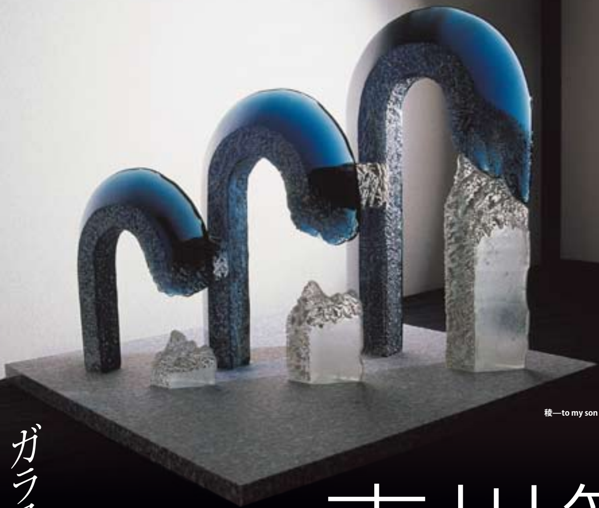
稜—to my son