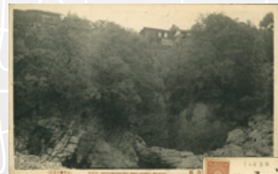
●津田青楓(画家)より 大正2(1913)年 9月18日