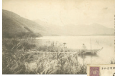
●藤岡作太郎(国文学者)より 明治41(1908)年 6月30日