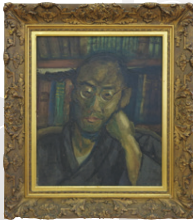
●津田青楓が描いた 西田幾多郎肖像画 年代不明